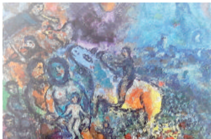
L'olio su tela «La famille», realizzato tra il 1978 e l'80